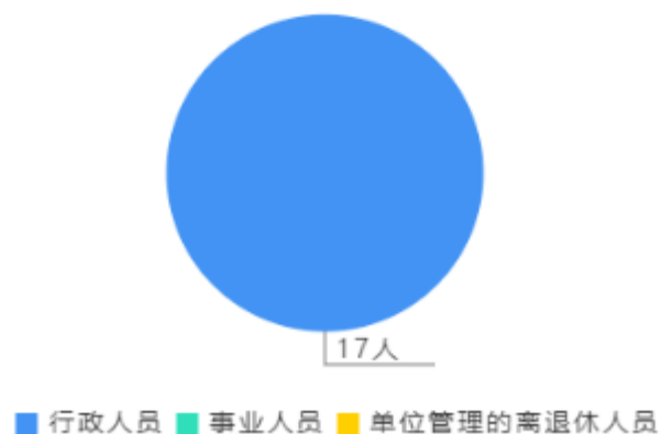
人员情况构成饼图