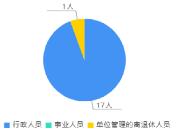
人员情况构成饼图