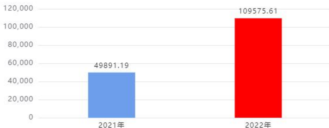
收入、支出决算总计对比图（单位：万元）

2022年度收入总计、支出总计均为109,575.61万元，与上年相比收入总计、支出总计均增加59,684.42万元，增长119.63%，增长的主要原因是：申请棚改三、四期项目专债，总支出增加。