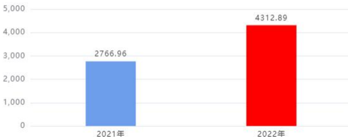
财政拨款支出对比图（单位：万元）